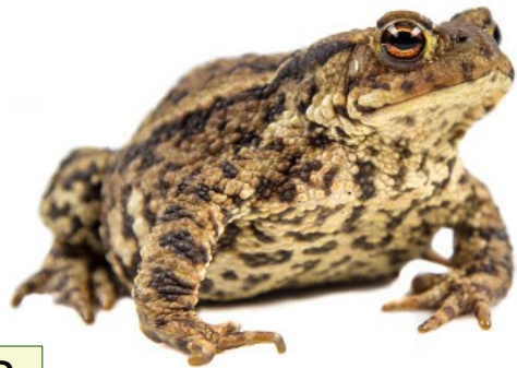
2 Crapaud commun