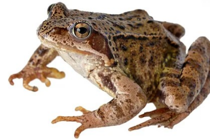
4 Grenouille rousse