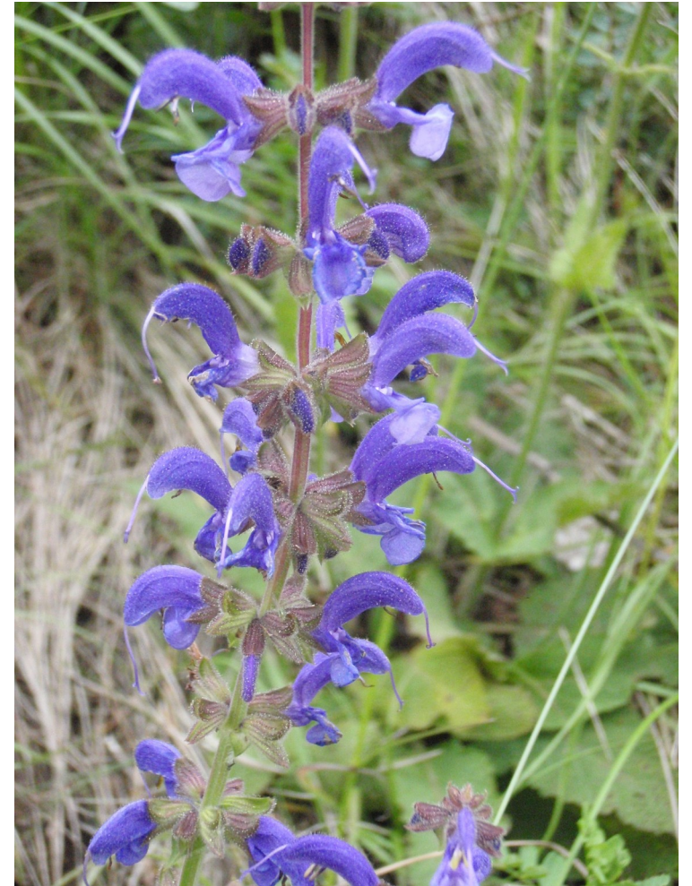
Sauge des prés