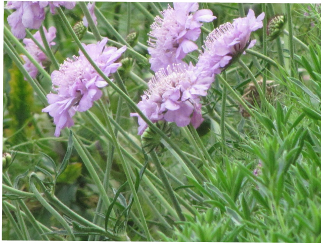
Knautie des champs