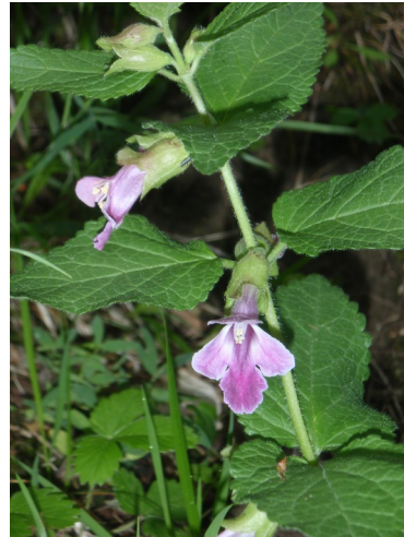
Mélitte à feuille de mélisse