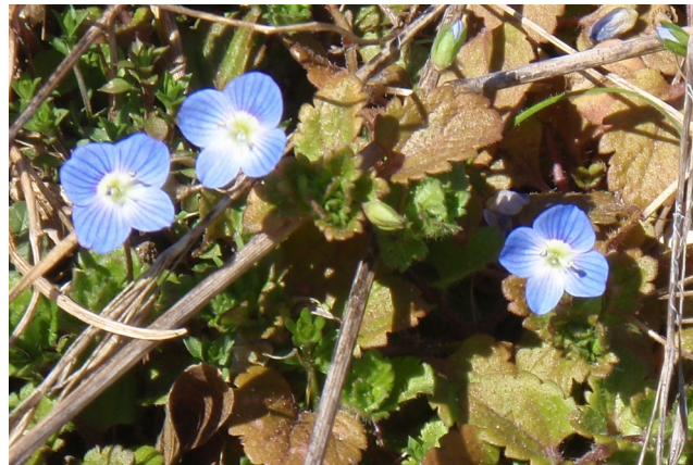
Véronique à feuille de lierre