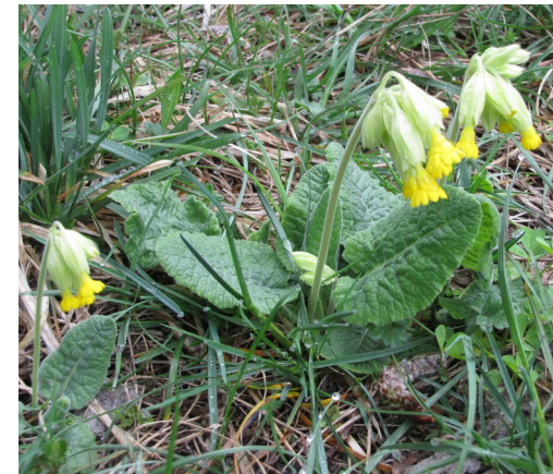
Primevère « coucou »