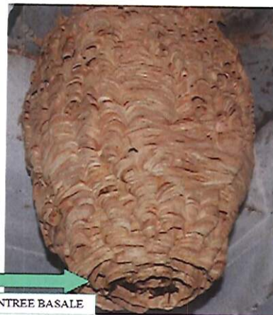
Nid secondaire – frelon européen

Le nid secondaire du frelon asiatique, qui héberge 2000 à 3000 individus, est délocalisé du nid primaire dans 70% des cas, si l'environnement devient défavorable ou l'emplacement trop étroit pour la colonie en croissance. Généralement il se situe à plus de 10, 15 mètres de haut dans un grand arbre, mais des cas particuliers sont à noter (bâtiments, haies,...). L'orifice de sortie est petit et situé latéralement sur le nid.