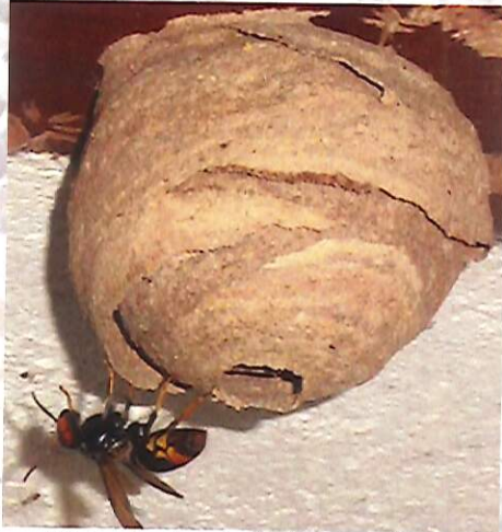
Nid primaire de frelon asiatique

Le nid primaire du frelon asiatique héberge 20 à 30 insectes. Il est généralement construit dans un endroit abrité à hauteur d'homme (ruche vide, cabanon, trou de mur, bord de toit, roncier...). L'orifice de sortie est situé à la base.