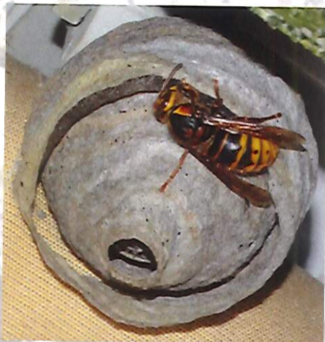
Nid primaire de frelon européen

Le nid primaire du frelon asiatique héberge 20 à 30 insectes. Il est généralement construit dans un endroit abrité à hauteur d'homme (ruche vide, cabanon, trou de mur, bord de toit, roncier...). L'orifice de sortie est situé à la base.